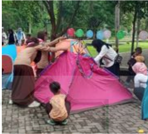
Gambar 2.1 Mendirikan tenda

para wali murid, dan itu juga arahan yang saya berikan kepada teman-teman guru untuk memudahkan para wali murid dan menjalin komunikasi baik juga.