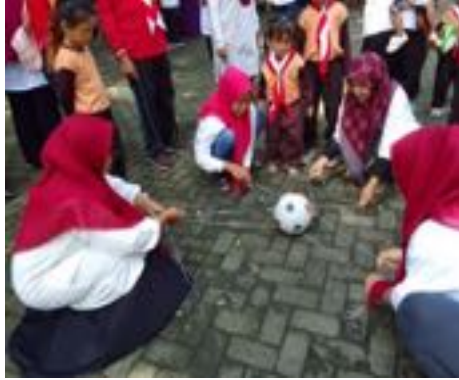
Gambar 2.9 Pengenalan permainan