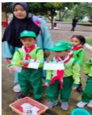
Gambar 2.11 Permainan menjepit huruf