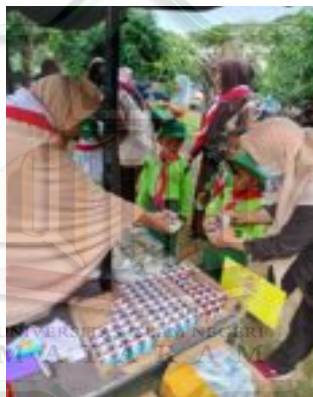
Gambar 2.12 Pemberian hadiah susu