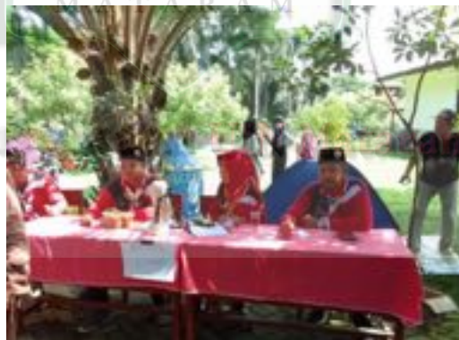
Gambar 2.8 Kegiatan bazar

Hasil wawancara diatas dapat diperkuat melalui dokumentasi kegiatan gebyar prasiaga