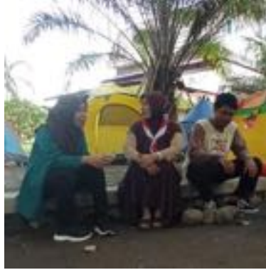
Gambar 3.1 Wawancara dengan kepala sekolah dan Pembina

Adapun upaya guru dalam menanamkan karakter anak melalui program pramuka prasiaga ialah dengan memberikan contoh secara langsung kepada anak-anak. Seperti pada uraian dari kegiatan prasiaga dibawah ini, sebagai berikut.