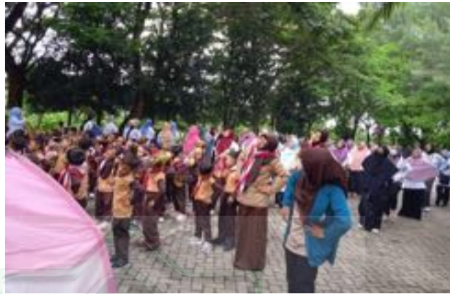
Gambar 2.3 Senam bersama

mau ikut kalau saya ikut senam kalau gak gitu dia main lari-larian aja dah sama temennya. 69