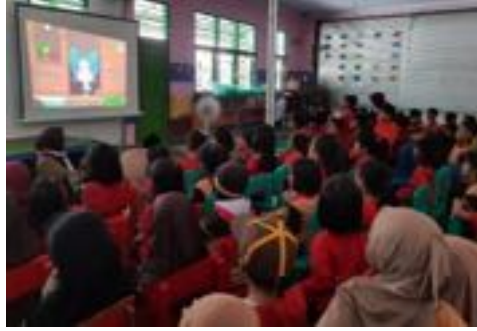
Gambar 2.6 Mendongeng