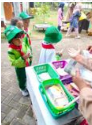
Gambar 2.13 Pemberian hadiah uang