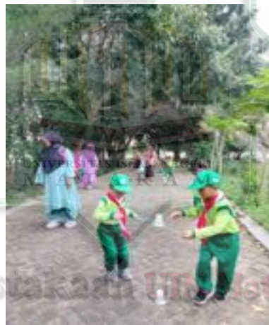
Gambar 2.10 Permainan memindahkan botol