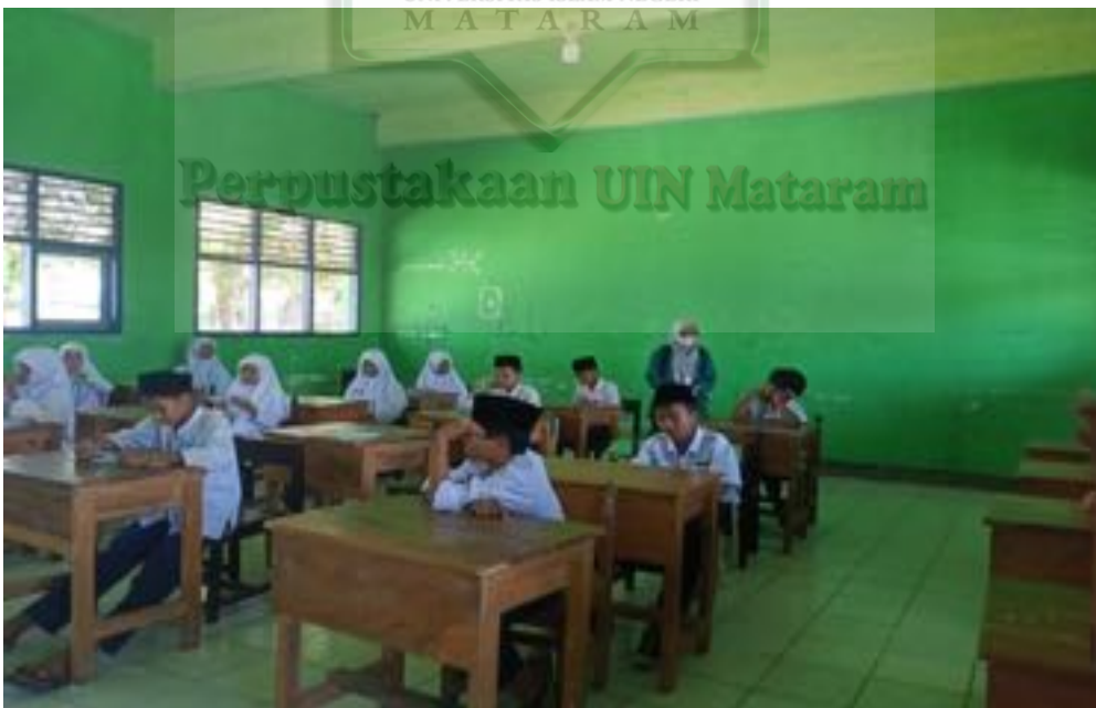
Proses wawancara menyeluruh dengan siswa di kelas