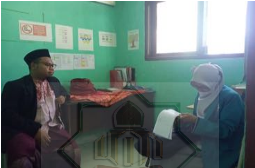
Wawancara dengan guru