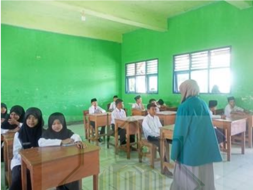
Proses pembelajaran dengan siswa di kelas