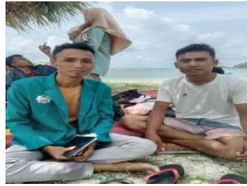
Tara Wisatawan domestik berasal dari Jawa Timur (Sumber: Dokumentasi Pribadi, 24 Januari 2023)