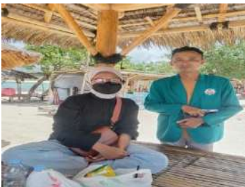
Mutia Wisatawan domestik berasal dari Sumbawa (Sumber: Dokumentasi Pribadi, 24 Januari 2023)