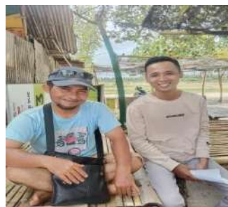
Epul Wisatawan Lokal berasal dari Batunyala (Sumber: Dokumentasi Pribadi, 26 Januari 2023)