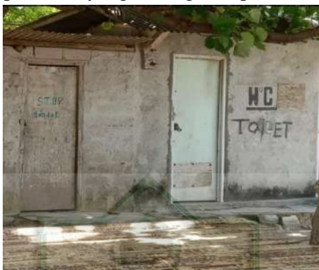
Gambar 2.3 Toilet

Terkait dengan toilet umum di area destinasi wisata Pantai Tanjung Aan belum bisa dikatakan memberikan kenyamanan bagi para wisatawan seperti bau yang kurang sedap di dalam area toilet.