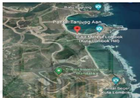
Gambar 1.1 Lokasi penelitian dilihat dari google Earth

Penelitian ini dilakukan di Pantai Tanjung Aan Lombok Tengah tepatnya di Desa Sengkol Kecamatan Pujut Kabupaten Lombok Tengah. Waktu yang peneliti tempuh dalam melakukan penelitian ini adalah 4 bulan yakni di bulan oktober samapi dengan Januari 2023. Alasan peneliti memilih Pantai Tanjung Aan sebagai lokasi penelitian ialah dikarenakan pantai ini memiliki daya tarik yang sangat indah dan sangat cocok untuk para wisatawan local maupun wisatawan asing. Meski pantai ini sudah di jadikan sebagai tempat rekreasi sudah sejak lama dan bahkan sudah termasuk dalam Kawasan Ekonomi Kreatif (KEK) namun masih banyak yang perlu di perbaiki seperti fasilitas-fasilitas wisata di kawasan Pantai Tanjung Aan Lombok Tengah.