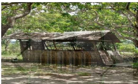
Gambar 2.5 Musholla

Hasil observasi dan wawancara terhadap tempat ibadah di Pantai Tanjung Aan bahwa untuk bangunannya memang masih sangat sederhana dan fasilitas seperti mukena, sarung dan sajadah masih sangat minim.