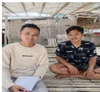
Andika Wisatawan Lokal berasal dari Kopang (Sumber: Dokumentasi Pribadi, 26 Januari 2023)