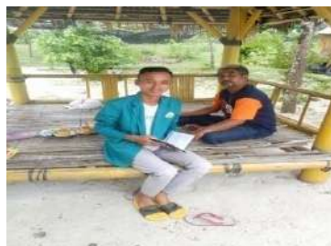
Hasnan Wisatawan domestik berasal dari Sumbawa