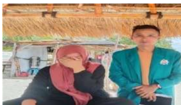
Riza Wisatawan Lokal berasal dari Kopang