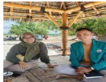
Latifa Wisatawan domestik berasal dari Bima