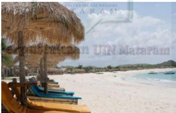
Gambar 2.8 Penataan Fasilitas Di Destinasi Pantai Tanjung Aan

Penatan fasilitas seperti berugak dan gazebo sudah sangat cocok karena penataannya langsung menghadap ke area pesisir pantai namun perlu di perhatikan oleh para pengelola ada beberapa berugak yang harus di ganti karena sudah rusak.