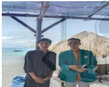
Riski Wisatawan domestik berasal dari Sumbawa (Sumber: Dokumentasi Pribadi, 24 Januari 2023)