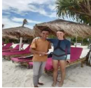
Viera Wisatawan mancanegara berasal dari Swedia