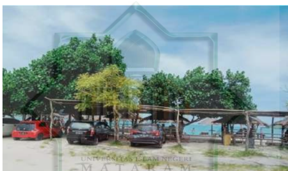
Gambar 2.2 Lahan Parkir

Fakta dilapangan terhadap lahan parkir ini memang sangat luas dan aman di karenakan para penjaga parkir selalu berada di area parkir.