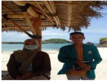
Andin Wisatawan domestik berasal dari Bima