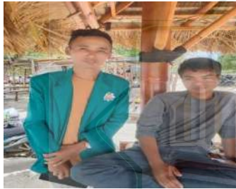
Dana Wisatawan Lokal berasal dari Kopang (Sumber: Dokumentasi Pribadi, 26 Januari 2023)