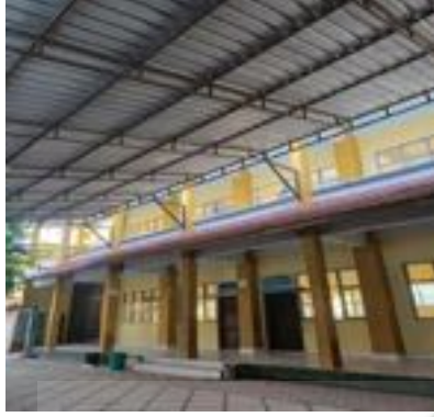
صورة لمبنى المدرسة