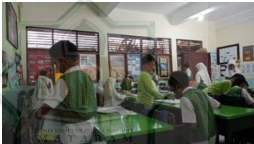
Gambar 2.7 Siswa Kurang Fokus Mengikuti Pembelajaran

Berdasarkan hasil observasi yang dilakukan oleh peneliti, terlihat bahwa masih ada siswa yang kurang aktif seperti adanya yang masih berbicara dengan teman sebangku, bermain dan mengantuk saat proses pembelajaran yang berlangsung. 185