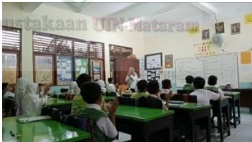
Gambar 2.2 Guru Memberikan Motivasi di Awal Pembelajaran

Bentuk pelaksanaan pengelolaan kelas sebelum pembelajaran yang dilakukan guru adalah dengan memeriksa kesiapan ruang belajar dan pengaturan posisi tempat duduk siswa yang diatur sesuai kondisi dan situasi di dalam kelas bertujuan untuk menertibkan siswa dalam proses pembelajaran. Selain itu, pengelolaan kelas lainnya adalah guru memberikan motivasi kepada siswa dalam belajar. 137