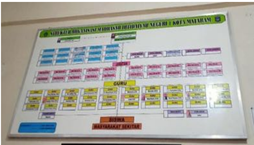
Struktur Organisasi MIN 1 Kota Mataram