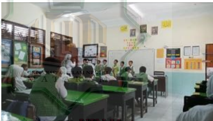
Gambar 2.6 Guru Mengelola Kelas dengan Baik

Berdasarkan hasil observasi di kelas, ditemukan bahwa terdapat faktor pendukung dan penghambat dalam pengelolaan kelas. Pengelolaan kelas dalam pelaksanaannya tidak terlepas dari berbagai faktor pendukung. 178