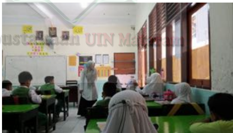
Gambar 2.1 Guru Memeriksa Kebersihan Kelas dan Mengatur Posisi Tempat Duduk Siswa

Berdasarkan hasil observasi, bahwa kegiatan sebelum pembelajaran dilaksanakan yaitu guru memeriksa kesiapan ruang, alat dan media pembelajaran. Dilanjutkan dengan mengucapkan salam dan meminta salah satu siswa memimpin doa. Setelah berdoa, guru menanyakan keadaan siswa dan mengabsensi. Kemudian saat akan memulai pembelajaran guru melakukan apersepsi dan penyampaian tujuan pembelajaran serta guru memberikan motivasi kepada siswa. 128