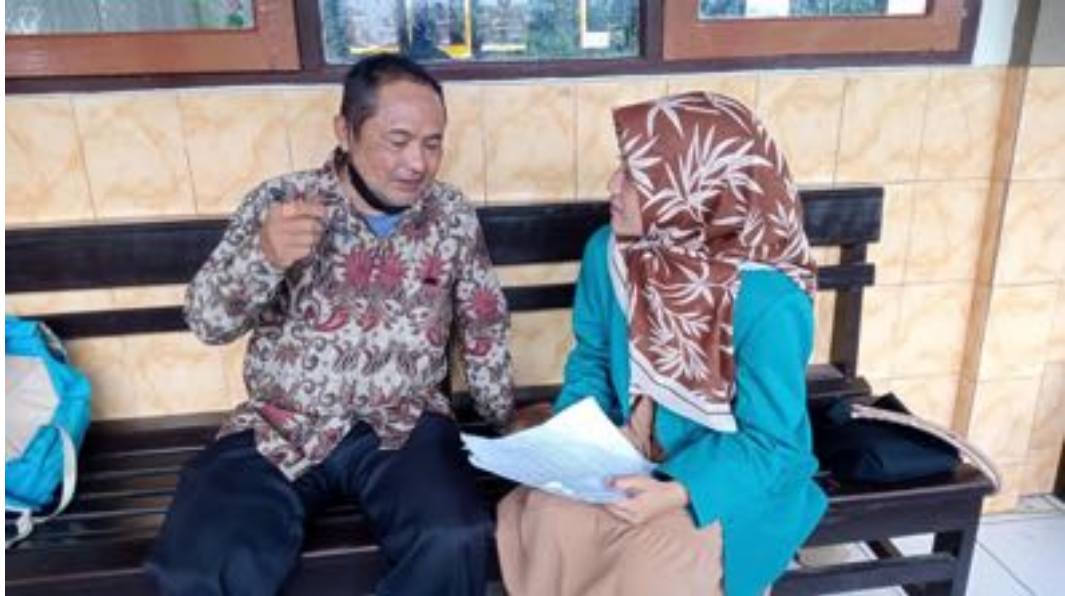
Wawancara Peneliti dengan Guru Kelas IVA