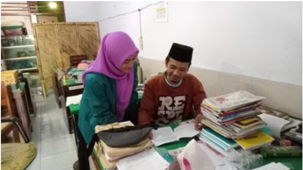
Wawancara Peneliti dengan Guru Kelas IVC