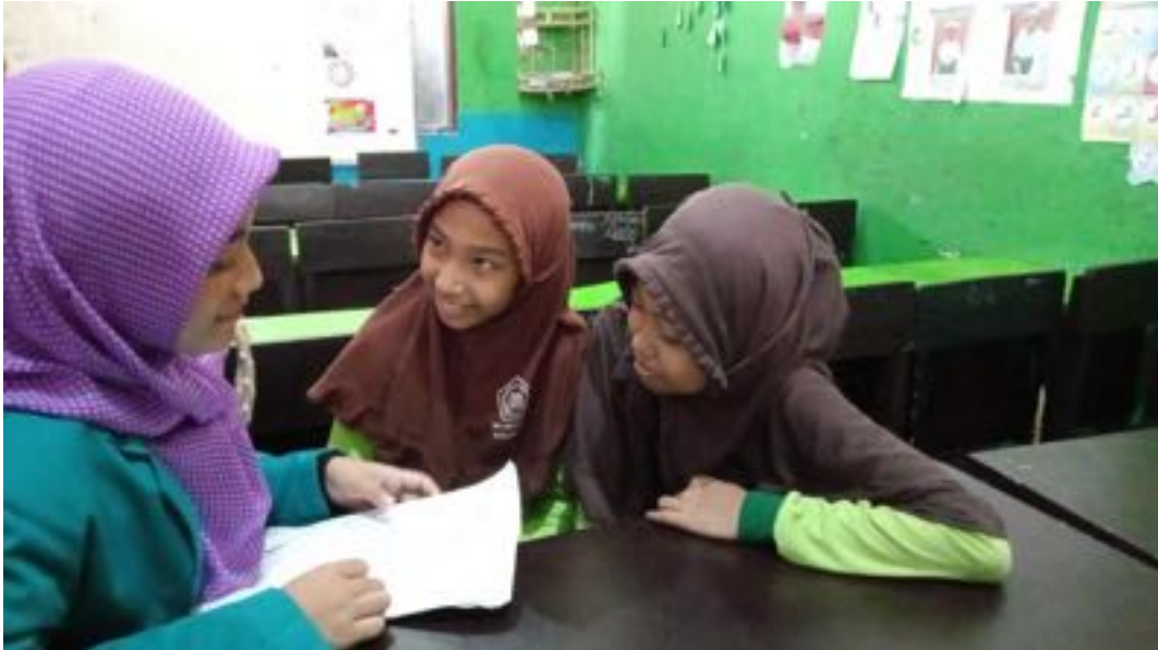
Wawancara Peneliti dengan Siswa Perempuan Kelas IVC