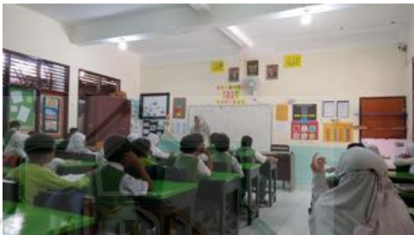
Gambar 2.4 Guru dan Siswa Menyimpulkan Materi Pelajaran

materi yang telah diajarkan. Kemudian siswa diajak menyimpulkan hasil belajar di hari itu sebagai bentuk penguatan dan guru juga mengadakan permainan. 153