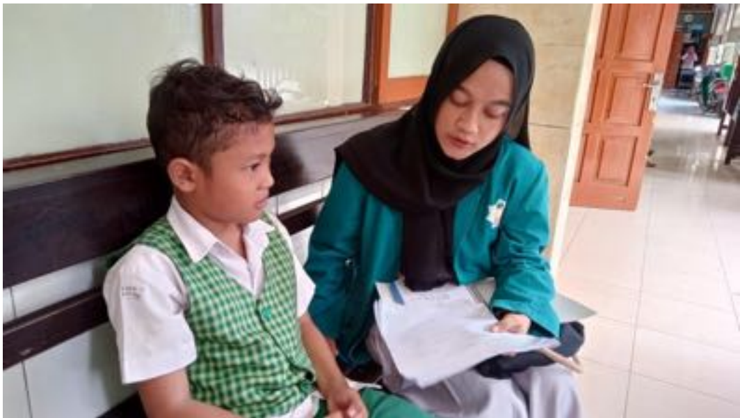
Wawancara Peneliti dengan Siswa Laki-laki Kelas IVB