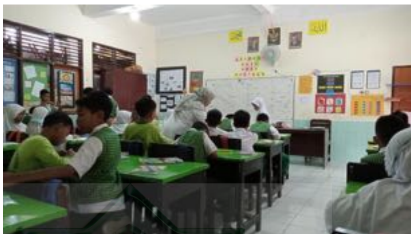
Gambar 2.5 Interaksi Guru dan Siswa sebagai Bentuk Pemberian Motivasi

Berdasarkan dokumentasi di atas, peran guru disini dimulai dengan memahami siswa terlebih dahulu dengan materi yang diberikan. Usaha yang dilakukan oleh guru yaitu menjelaskan kembali kepada siswa terkait yang belum dimengerti dan dipahami terhadap materi yang diajarkan. Selain itu, guru akan memberi nilai atau pujian kepada siswa yang mampu menguasai materi agar siswa mampu bersaing dengan temannya untuk meningkatkan motivasi dan semangat belajar yang tinggi. 163