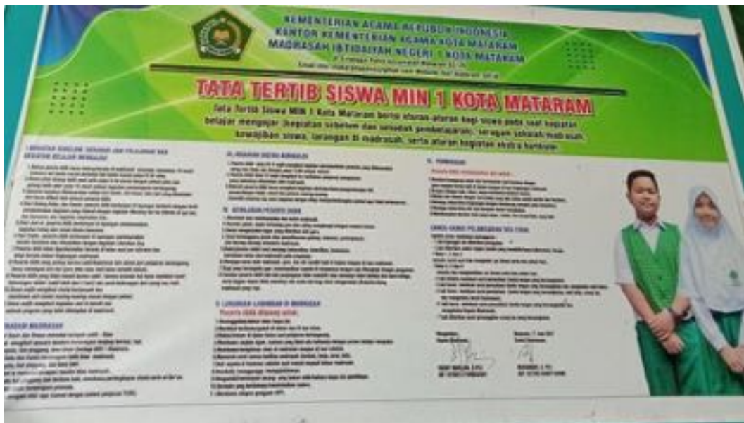
Tata Tertib MIN 1 Kota Mataram