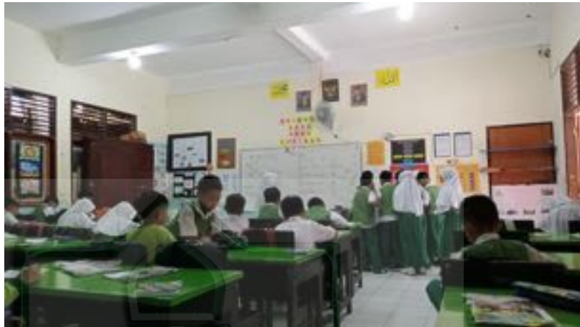
Gambar 2.3 Siswa Mengerjakan Tugas

kondusif selama belajar dan apa yang menjadi tujuan atau target pembelajaran bisa tercapai. 145