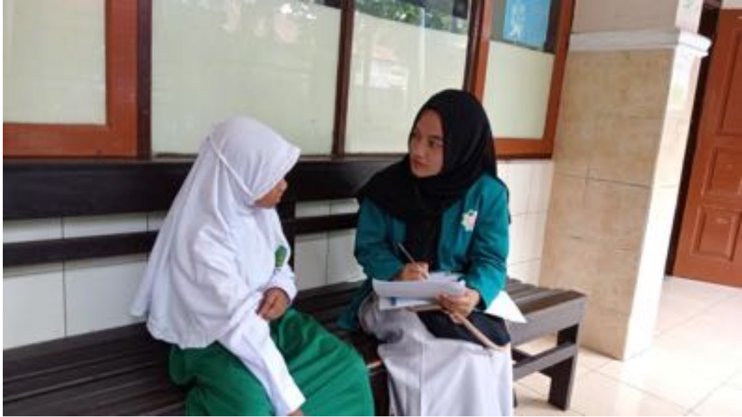
Wawancara Peneliti dengan Siswa Perempuan Kelas IVB