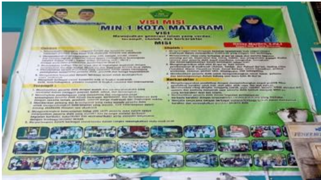
Visi-Misi dan Tujuan MIN 1 Kota Mataram