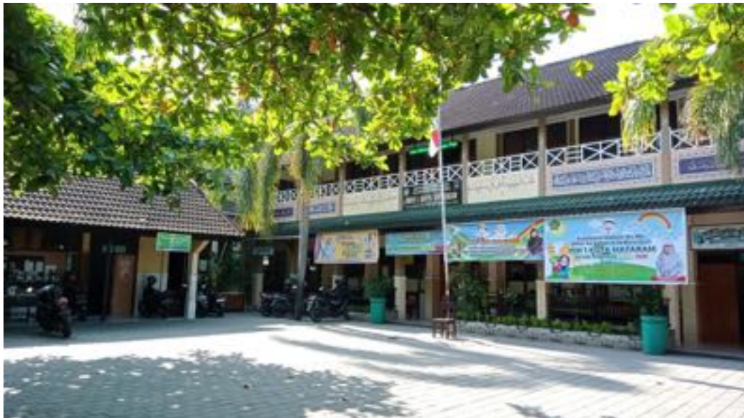
MIN 1 Kota Mataram