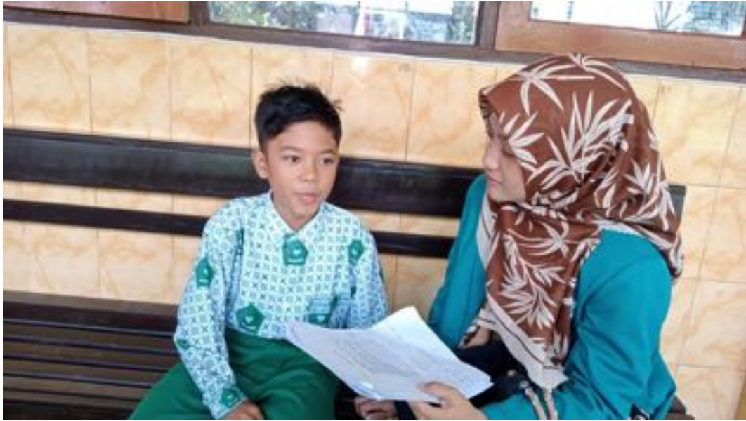
Wawancara Peneliti dengan Siswa Laki-laki Kelas IVA