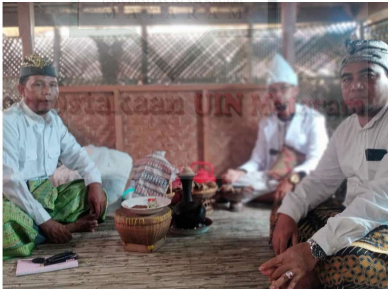
Foto menjelang puncak ritual maulid adat sesait