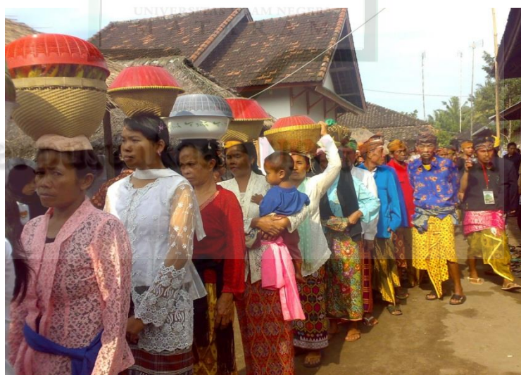
RITUAL MEREMBUN HASIL BUMI DAN HEWAN