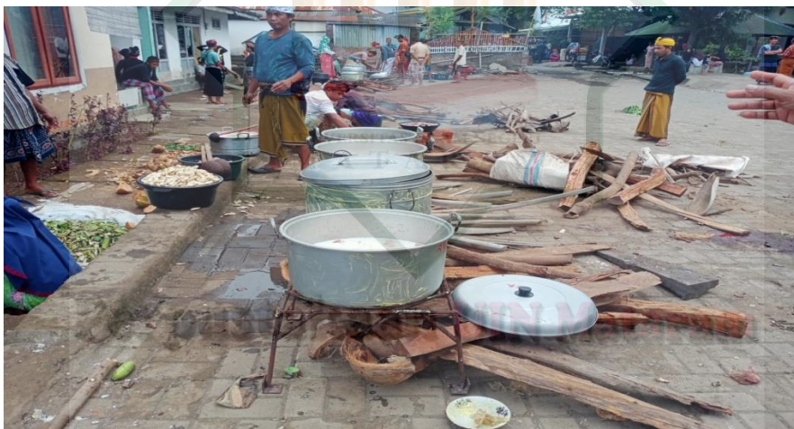
RITUAL MASAK DAGING DAN SAYUR RANGKAIAN PROSESI MAULID ADAT SESAIT.