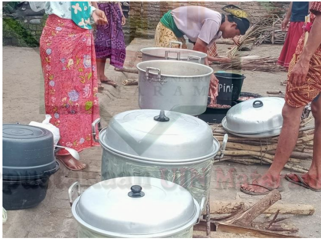
RITUAL MASAK NASI DAN SAYUR RANGKAIAN PROSESI MAULID ADAT SESAIT.